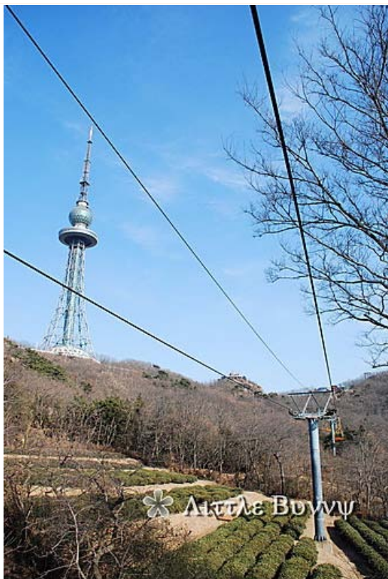
途中見到山上有兩個球狀物體