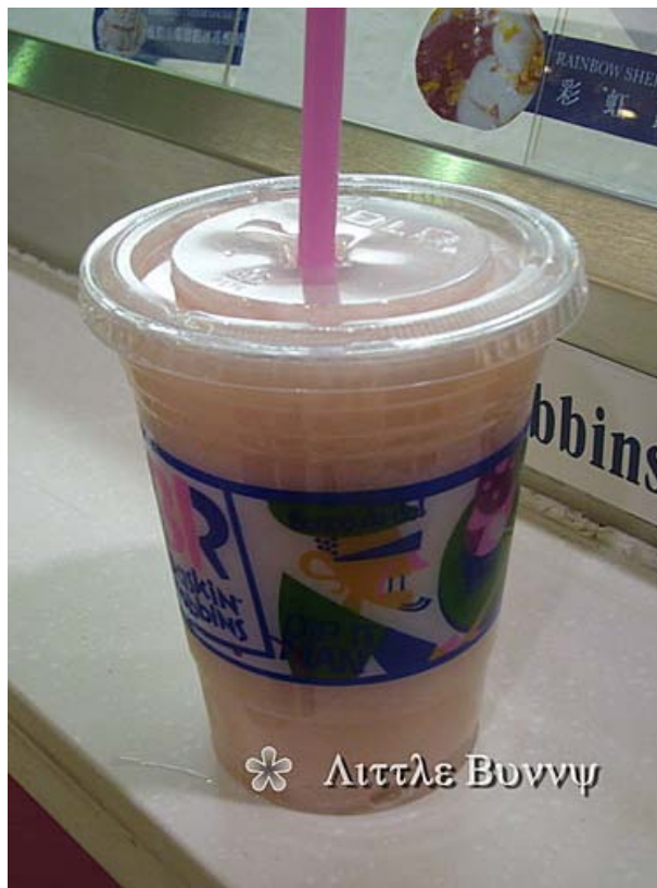
呢間Baskin Robbins主要係賣雪糕，D雪糕o既顏色好染色